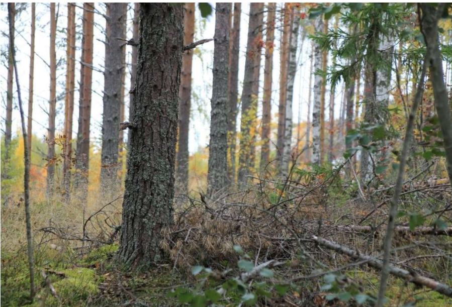
Kuvattu Louhilammen rantapenkalta, takana näkyy nykyiset alueen kivimassavarastot, toisin kuin väitetään, ei välissä ole suojaa rantavyökkeelle

Lupahakemuksen mukainen ottamisalue on osoitettu Pohjois-Karjalan ohjeellisessa maakuntakaavassa merkinnällä EO3 (kalliokiviainesten ottoalue). Alue on merkitty Vaivion osayleiskaavassa merkinnällä eo-2 (kallioainesten ottoalue) ja M (maa- ja metsätalousvaltainen alue). Ottaminen ei vaikeuta alueen käyttämistä kaavassa varattuun tarkoitukseen. Ottotoiminnan jälkeen alue palautetaan metsätaloukseen.